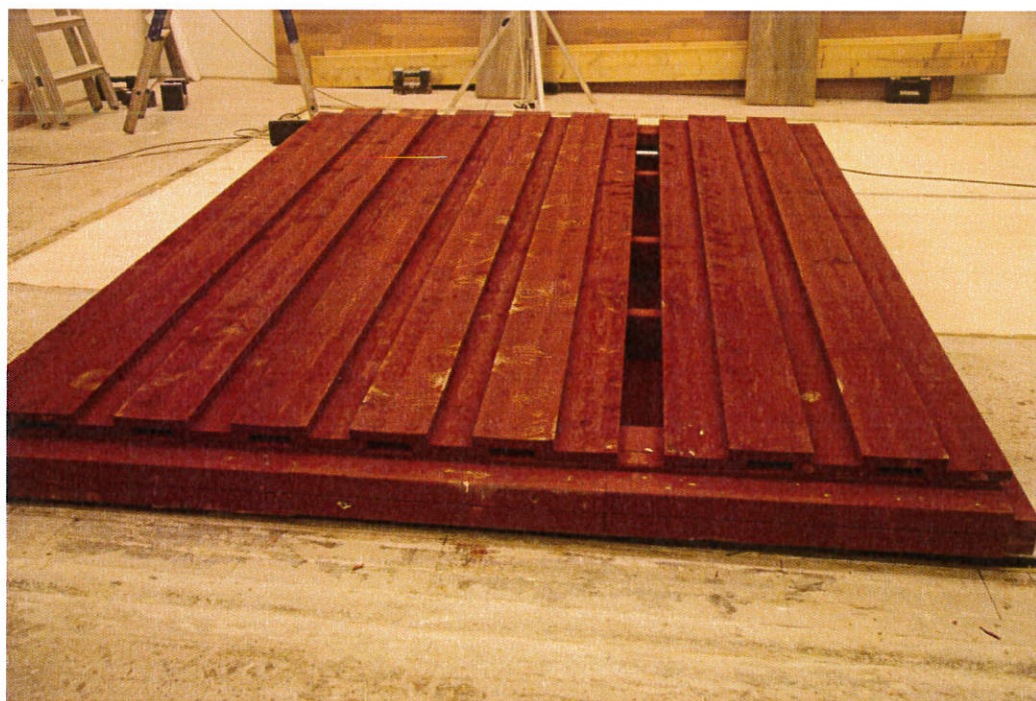
Bild 4 – Skärmen var ihålig bakom lockpanelen. De inre tvärgående reglarna kan ses.